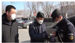
随后听取了榆垓镇隔离点管理 及疫情属地管理工作开展的情况